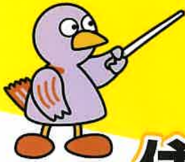
埼玉県 マスケット コバトン