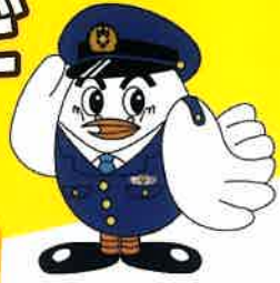
埼玉県警察 シンボルマスケット ポッポくん

>>>>>>>> 「保険が使える」という住宅トラブルなどの相談事例 <<<<<<<<<